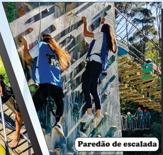
Paredão de escalada